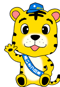
二本木小マスコットキャラクター “おはトラ”

2 会場 安城市立二本木小学校 〒446-0055 愛知県安城市緑町1丁目23番地1 電話 0566-76-4449 FAX 0566-76-4407 E-mail nihongi@anjo.ed.jp