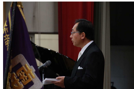
第69回入学式での校長式辞の様子

平成29年度がスタートしました。本年度は、生徒数840名、教職員数70名でのスタートとなりました。学級数は、8・7・8学級と特別支援学級2学級の合計25学級となります。