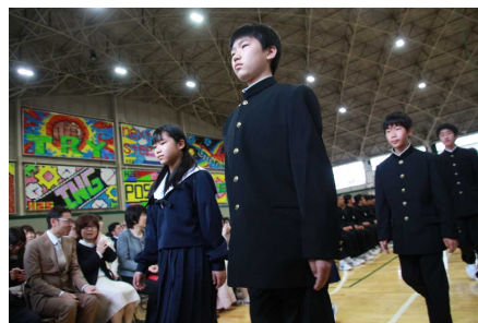
颯爽と退場する新入生