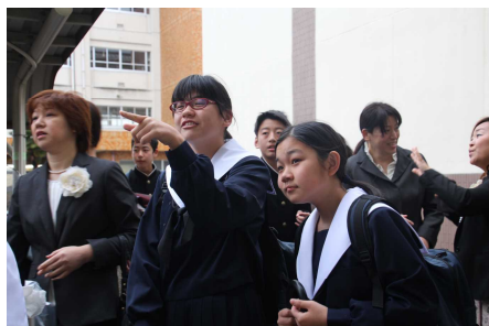
学級発表を見る新入生の皆さん