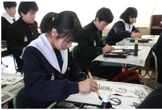
みんな真剣 ～書き初め会の様子～