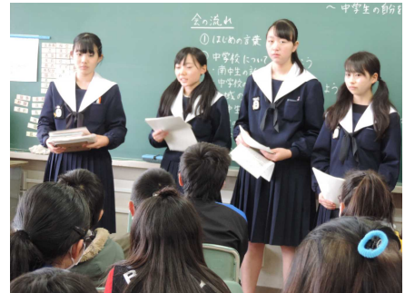
錦町小学校ふれあい会議での代表生徒

また、2月9日(木)には錦町小学校ふれあい会議に本校代表生徒が訪問し、小学6年生の中学校生活に関する質問に直接答える機会を設けました。中学3年生が答えることもあって、6年生は最初緊張気味でしたが、どの児童も真剣に話を聞いていました。学校の代表として参加をしてくれた生徒会役員や3年生の生徒の皆さん、ありがとうございました。