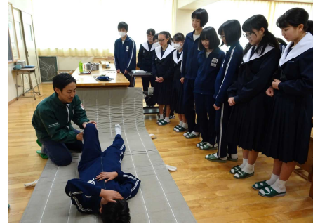
職業セミナーでの実習の様子

1月31日(火)午後、安城南中学校におけるキャリア教育の一環として「職業セミナー」を開催しました。今回用意したのは11講座。講座を2回行っていただき、生徒は関心の高い講座に行ってお話を聞くという方式をとりました。1年生は、まずは職業を知る段階。自分にとって魅力ある職業というのは、どのような出会いがあるかはわかりません。今回は様々な「仕事」と、その職種で第一人者の話を聞いてもらえればと思いつきました。特に今回は、愛知県教育委員会義務教育課「魅力あるキャリアプロジェクト」のうち「キャリアコミュニティプロジェクト」の一環として、「ものづくり」にかかわる職種の方々に多くご参加いただきました。みんなが熱心にメモを取っている姿がとても印象的で、将来に向けて真剣な姿勢を感じました。お忙しい中、講師のみなさまのご協力に感謝申し上げます。