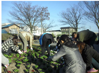
花壇整備 (PTA・oneボランティア)