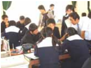
モーターが回る。では、電子の流れは? 3年 理科 10/4(火)