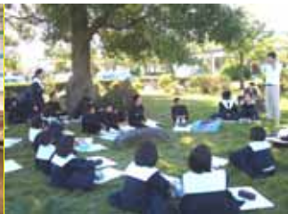
明中のシンボル橋への思いを表現するには 1年 美術 10/31(月)