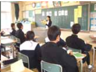
本文の場面に合う挿絵はどれか? 1年 国語 10/20(木)