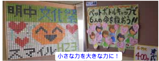
小さな力を大きな力に!