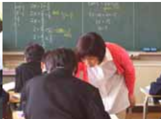
係数に分数がある方程式を解くには... 1年 数学 10/17(月)