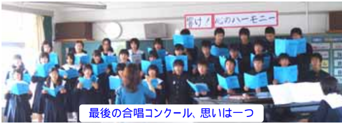
最後の合唱コンクール、思いは一つ