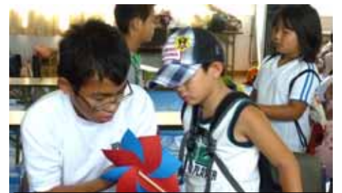
よっといでんクラブ (東端町内会)

休み中、各町内会の諸行事や納涼まつり、諸機関や団体主催の行事にすすんで参加しました。のべ 100 名を超える生徒が自分の時間と心と体を生かし、郷土や社会のために貢献しました。郷土に支えられ、育てられた自分を生かす機会に身を投じ、自己有用感や達成感を味わった「さわやか明中生」に拍手を送るとともに、ますますの活躍を期待します。