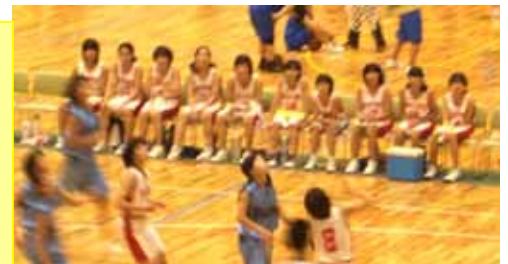
バスケットボール部女子 西三河大会で善戦