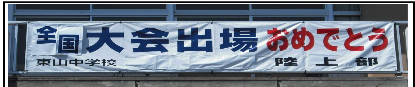
陸上部 3年7組 生徒

7月20日の県通信大会で、僕は110mハードルの全国大会参加標準記録を突破した。全国大会は中学生になってからの僕の目標だったから、嬉しかった。