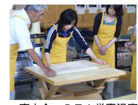
東山会・PTA学事視察

6月27日(土)「市P連ボウリング大会」で東山中学校PTAが見事優勝しました。PTA役員の方々の素晴らしい活躍に感謝いたします。