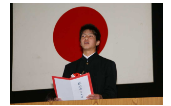
歓迎の言葉（入学式）

その目標を達成するために、僕たちは身を粉にして働く覚悟はできています。だからみなさんも「こんなことをして欲しい」と思ったら、すぐに意見箱を通して、教えてください。その意見を実現させるために、最大限努力します。学校は、みなさんの力無しでは変えることができません。半年という短い期間ですが、生徒会へのご協力をお願いします。