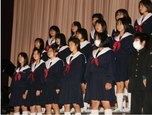
1組『名付けられた葉』

お誘い合わせの上、歌声を聴きに来ていただきたいと思います。なお、当日はマスクの着用をお願いします。