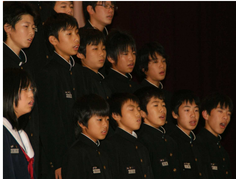
2組『 We are the world 』